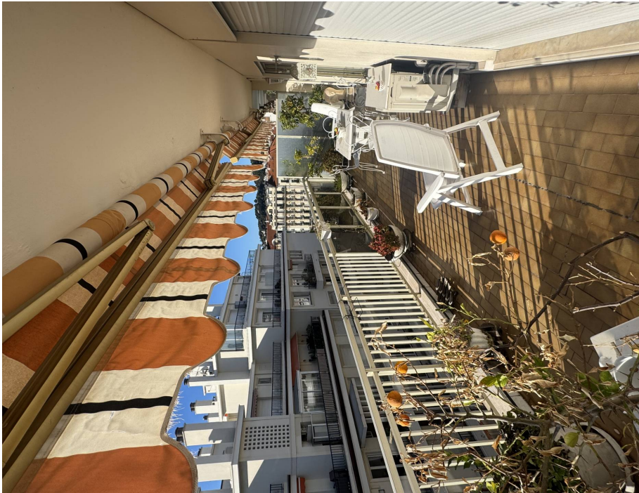
Nice Musiciens // Paul Déroulède