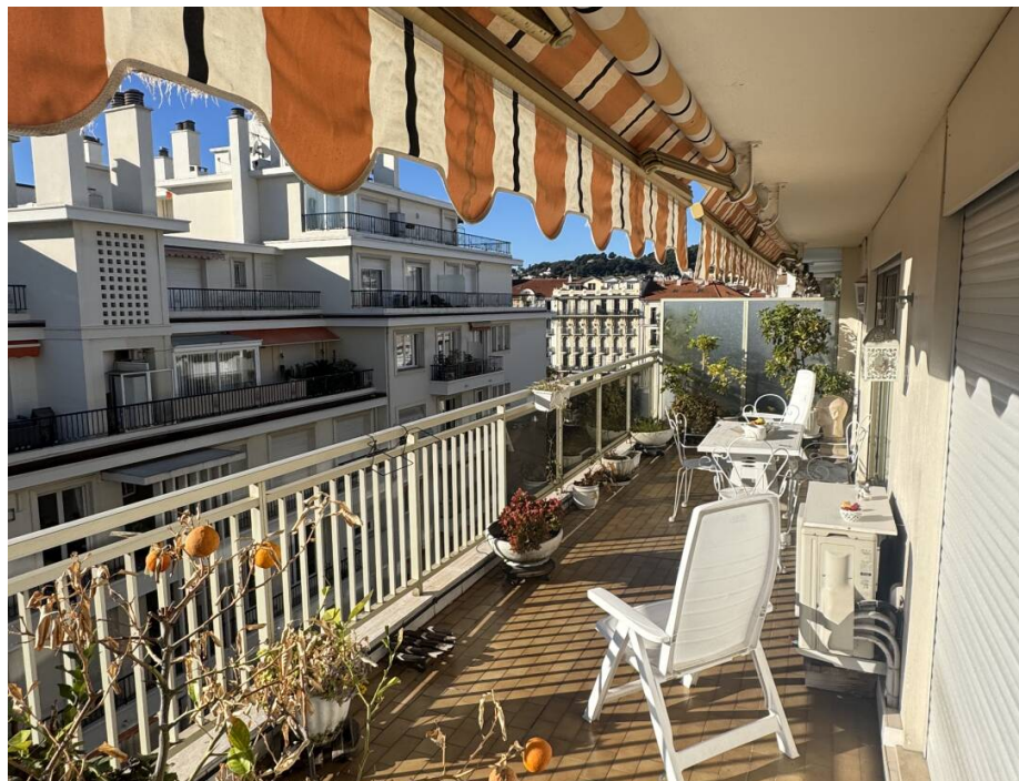
Nice Musiciens // Paul Déroulède