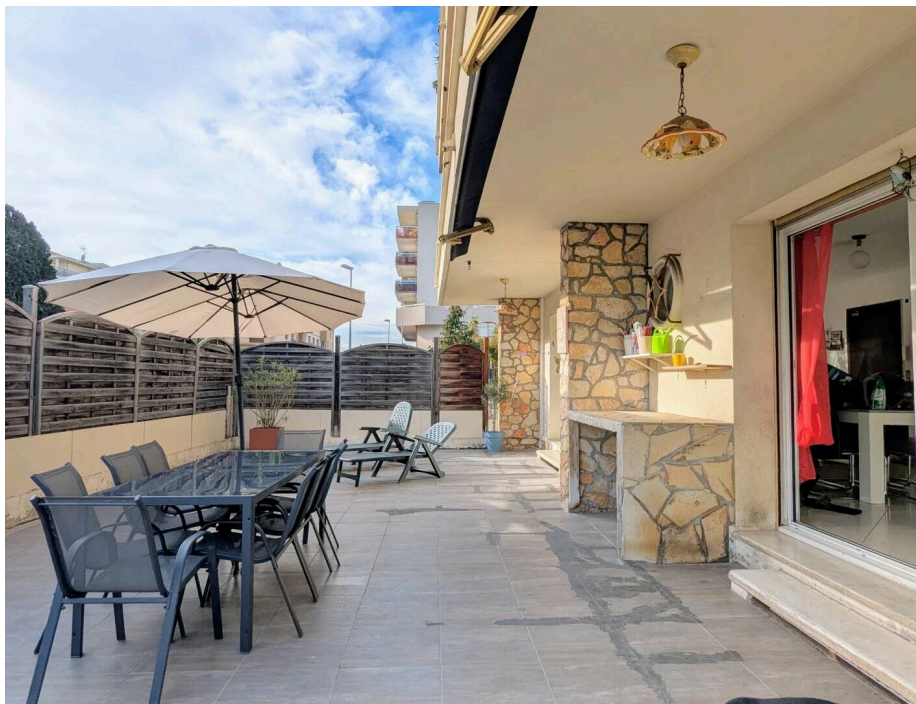
SAINT LAURENT DU VAR - Grand appartement familial 7 pièces avec jardin et terrasse

Dans le centre de Saint-Laurent du Var, au calme dans une petite rue résidentielle, tout en étant à 250 mètres des commerces, services et écoles, cet appartement est également proche de Cap 3000, de la gare, des accès routiers et de la plage.