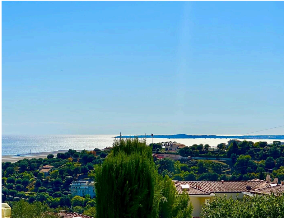
4 Pièces Vue Mer - St Pierre de Féric

Situé dans le quartier résidentiel prisé de Saint-Pierre-de-Féric à Nice, nous vous proposons un bel appartement d'angle, au sein d'une prestigieuse résidence de standing sécurisée, offrant un cadre de vie privilégié avec une vue panoramique exceptionnelle sur la mer et le Cap d'Antibes.