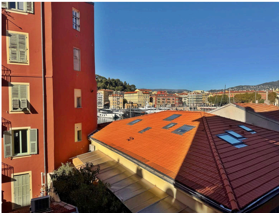
NICE LE PORT / VUE PORT - LUMINEUX & CALME