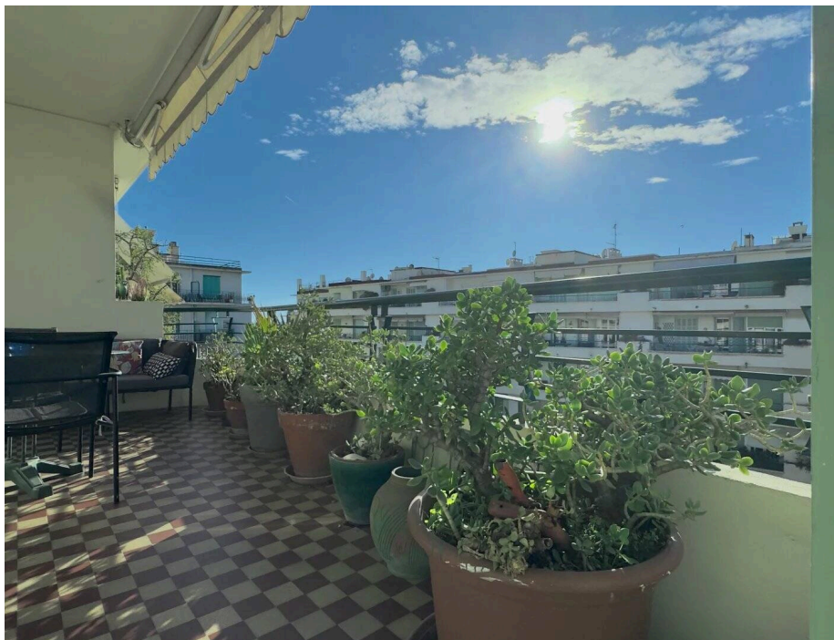
Le Capitole - 3 Pièces Dernier étage - Terrasses - Vue Jardin & Échappée Mer - Exceptionnel - Traversant

Dans l'une des résidences les plus emblématiques de la Côte d'Azur, conçue entre 1947 et 1962 par les architectes Georges et Michel Dikansky, découvrez ce superbe appartement en dernier étage avec ascenseur, à deux pas de la Promenade des Anglais.