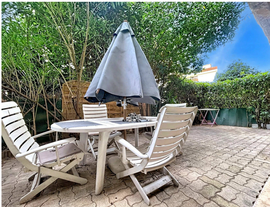
NICE NORD Saint Sylvestre