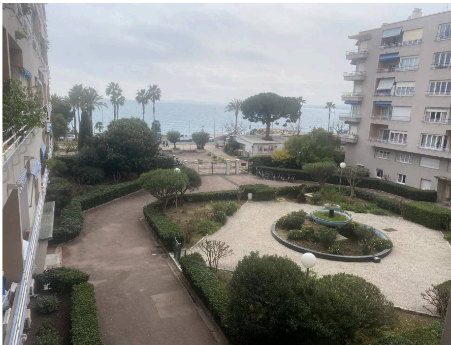
CROS DE CAGNES 2 P. Cros de Cagnes

Idéalement situé à 50 mètres des plages du Cros et des commerces, dans une résidence prisée et sécurisée avec espaces verts, vous apprécierez cet appartement pour profiter de la promenade de la plage et de l'emblématique village des pêcheurs.