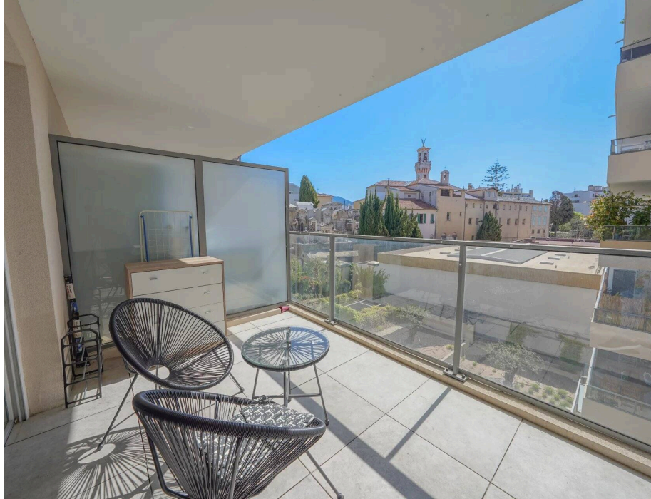
Studio quartier St Barthelemy

Au sein d'une résidence moderne livrée en 2020, sécurisée et parfaitement entretenue, découvrez ce charmant studio.